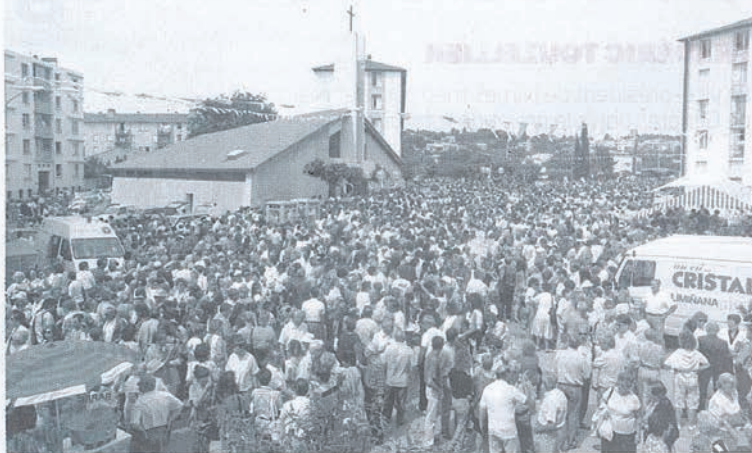
Lors de la procession mariale le jour de l'Ascension au sanctuaire de Santa Cruz à Nîmes.

Quand de nombreux Pieds-noirs sont venus s'installer, après la guerre d'Algérie, dans les logements HLM du Mas de Mingue (350 familles en septembre 1963, soit environ 1 200 personnes, dont 95 % d'Oranais), l'idée d'un retour de la tradition de Santa Cruz à Nîmes s'est vite imposée.