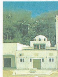
Le site du Mas de Mingue.

► Correspondant Midi Libre : 07 81 33 15 81