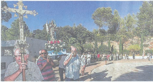
Le retour jeudi 18 mai de la traditionnelle procession au sanctuaire de Notre-Dame de Santa Cruz.

Au sanctuaire construit sur les hauteurs du Mas de Mingue, depuis près de 60 ans, chaque jeudi de l'Ascension, des milliers de personnes, des milliers de personnes, des milliers de personnes, assistent au pèlerinage de Notre-Dame de Santa Cruz.